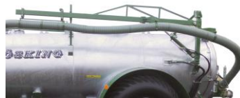
Hydraulisk kran monteras bak på tankens vänstra eller högra sida