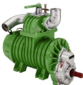
JUROP - Kompressor