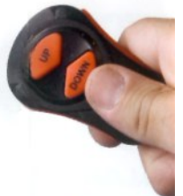
PUSH-BUTTON DEPTH ADJUSTM

Med fjärrkontrollen skiftar man även mellan arbetsläge och transportläge. Med det medföljande batteriet kan över 800 upp/ner-rörelse utföras på en uppladdning. En rymlig belastningslåda medföljer för de mest svåra arbetsförhållanden.