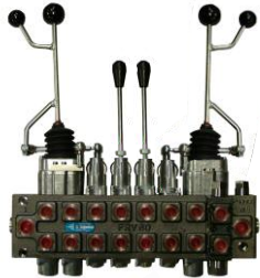
Zwei Hebel mit Koordinator FRV 60/7-T & FRV 60/8-T