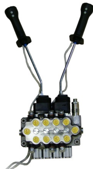
Leichtausführung mit el. On/Off 2xTR55/4