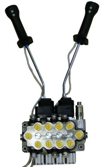
Leichtausführung mit el. On/Off 2xTR55/4