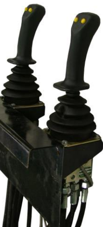
Joystick mit hydr. Vorsteuerung FRV 60/8-P