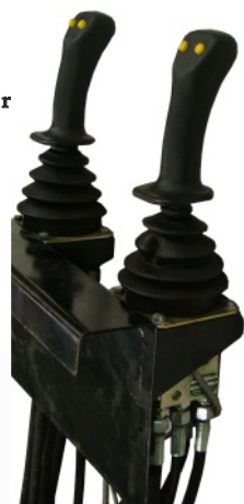
Joystick mit hydr. Vorsteuerung FRV 60/8-P

Aufpreise beim Kauf eines kompletten Ladekrans siehe S. 13-14.