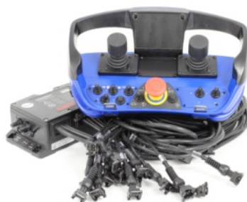
Fernsteuerung Scan Reco Maxi 3-0-3