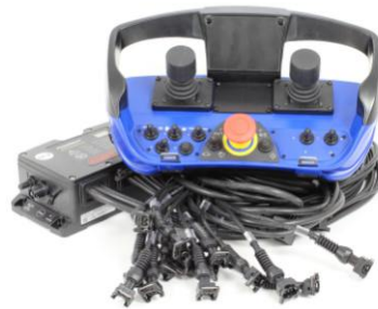
Fernsteuerung Scan Reco Maxi 3-0-3