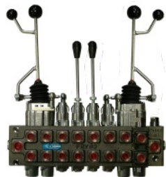
Zwei Hebel mit Koordinator FRV 60/7-T & FRV 60/8-T