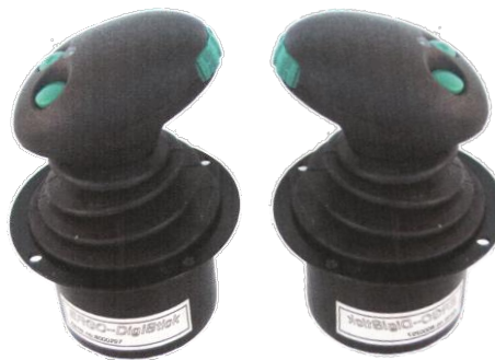
Voll elektrischer Joystick BC/60-8