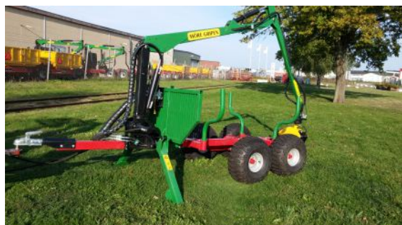
Kraftig ram-konstruktion med flyttbara bankar som är utrustade med låsfunktion.