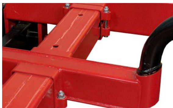
Kraftig ram-konstruktion med flyttbara bankar som är utrustade med låsfunktion.