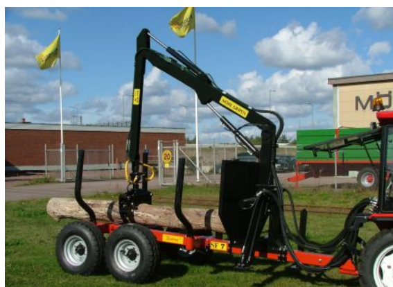
Kraftig ram-konstruktion med flyttbara bankar som är utrustade med låsfunktion.

Kraftig ram-konstruktion med flyttbara bankar som är utrustade med låsfunktion. med flyttbara bankar som är utrustade med låsfunktion. med flyttbara bankar som är utrustade med låsfunktion. med flyttbara med flyttbara bankar som är utrustade med låsfunktion. bankar som är utrustade med låsfunktion.